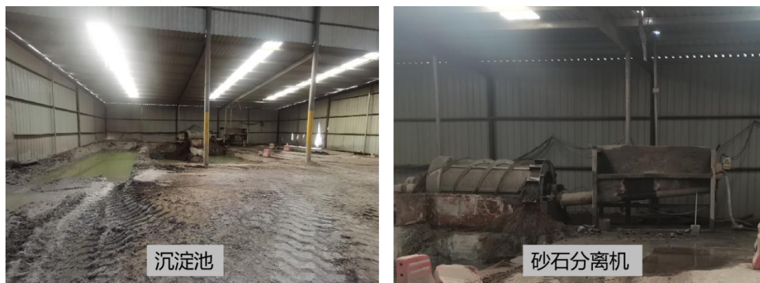
图 3-3 项目沉淀池照片