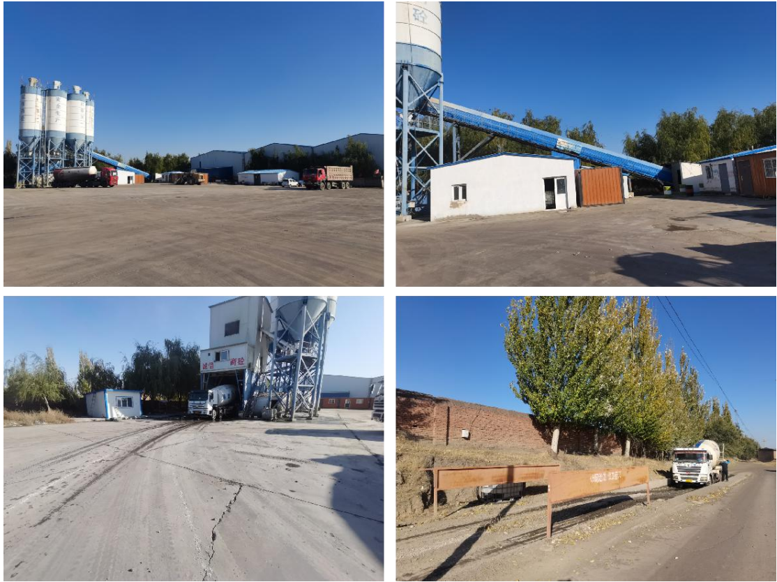
图 3-4 项目厂区现场照片