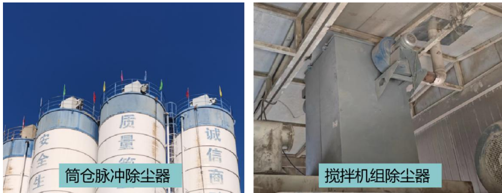
图 3-1 项目除尘设备照片

置 1 套袋式除尘器，搅拌粉尘经袋式除尘器处理后高空外排。目前厂区除尘设备环保设施照片见下图 3-1，密闭车间及密闭输送带照片见下图 3-2。