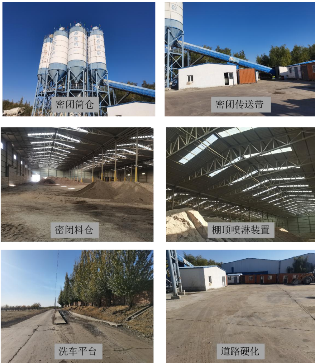
图 3-2 项目密闭车间照片